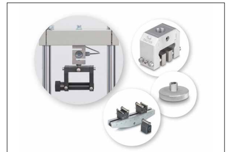
Solide und flexible Befestigungsmöglichkeiten durch eine hohe Anzahl an Klemmen und Zubehörfteilen aus dem SAUTER Sortiment, siehe Zubehör